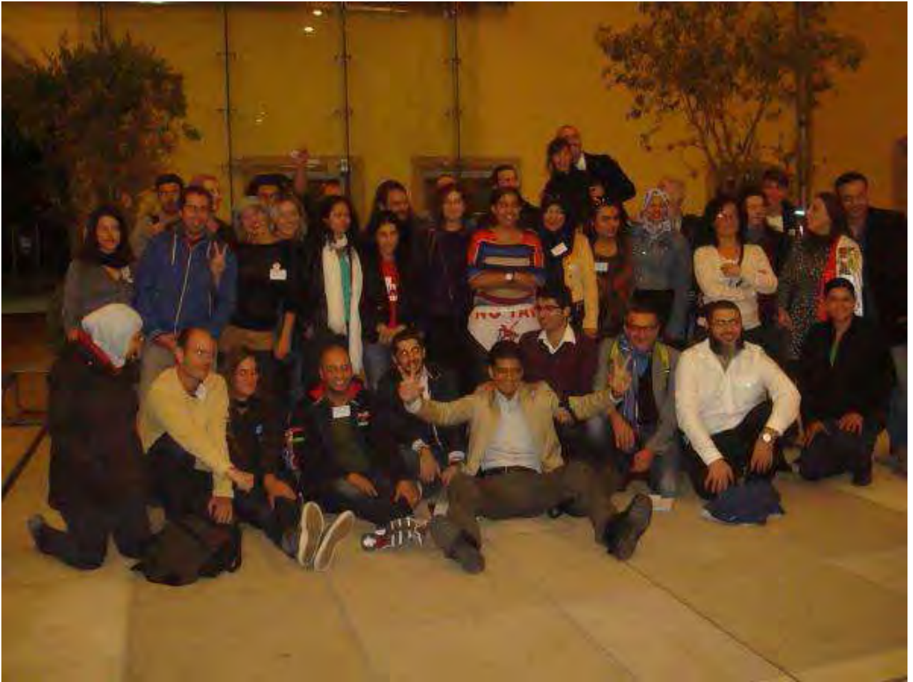
Foto di gruppo

“Nonostante origini, culture e società diverse, abbiamo scoperto attraverso il dialogo e le esperienze condivise che ciò che ci unisce è più importante di ciò che ci divide nella nostra lotta. Una lotta volta a creare le condizioni nelle quali gli esseri umani possano vivere con dignità, libertà e pace.”