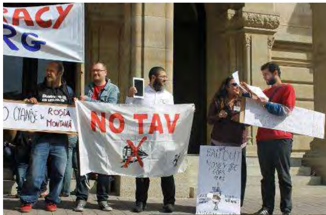
Manifestazione: Davanti all'ufficio di Jean-Claude Juncker, capo del Eurogroup dell'Unione Europeo nel centro di Lussemburgo